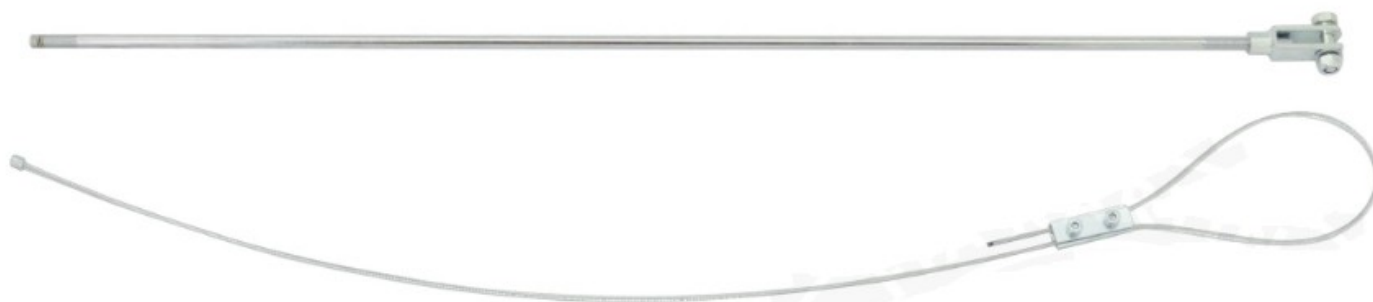
Photo du câble de la commande de freinage / Photo of brake control cable

La commande de freinage doit être isolée du châssis et montrer la double commande. / The brake control must be separated from the chassis and the double linkage must be shown.