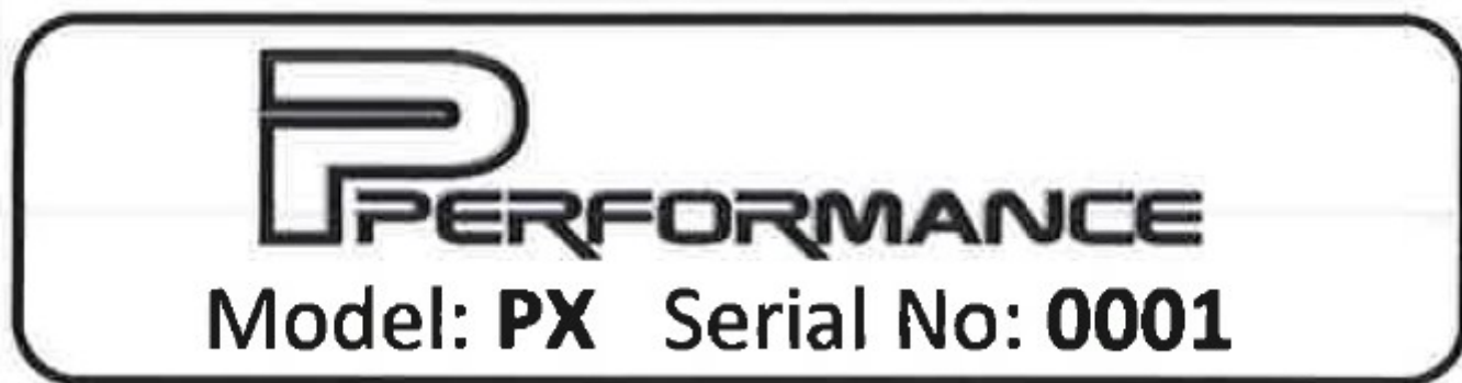
Photo du marquage du numéro d'homologation / Photo of the homologation number marking

Le marquage indiqué sur le tube transversal arrière doit rester clairement visible en permanence. / The marking located on the rear strut must be clearly visible at all times.